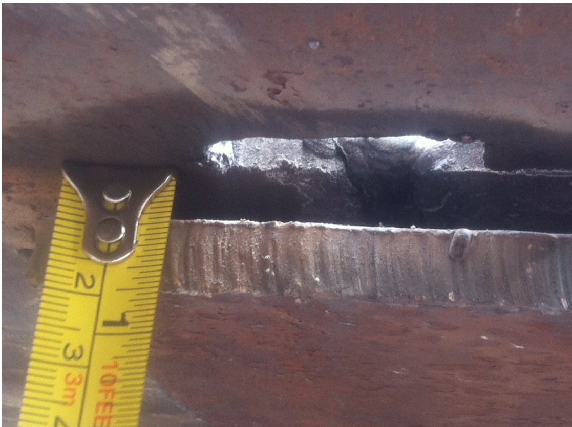
Photo n°8 : Vue de dessous de la pièce pour QS (jeu avec la latte support de 6 mm)