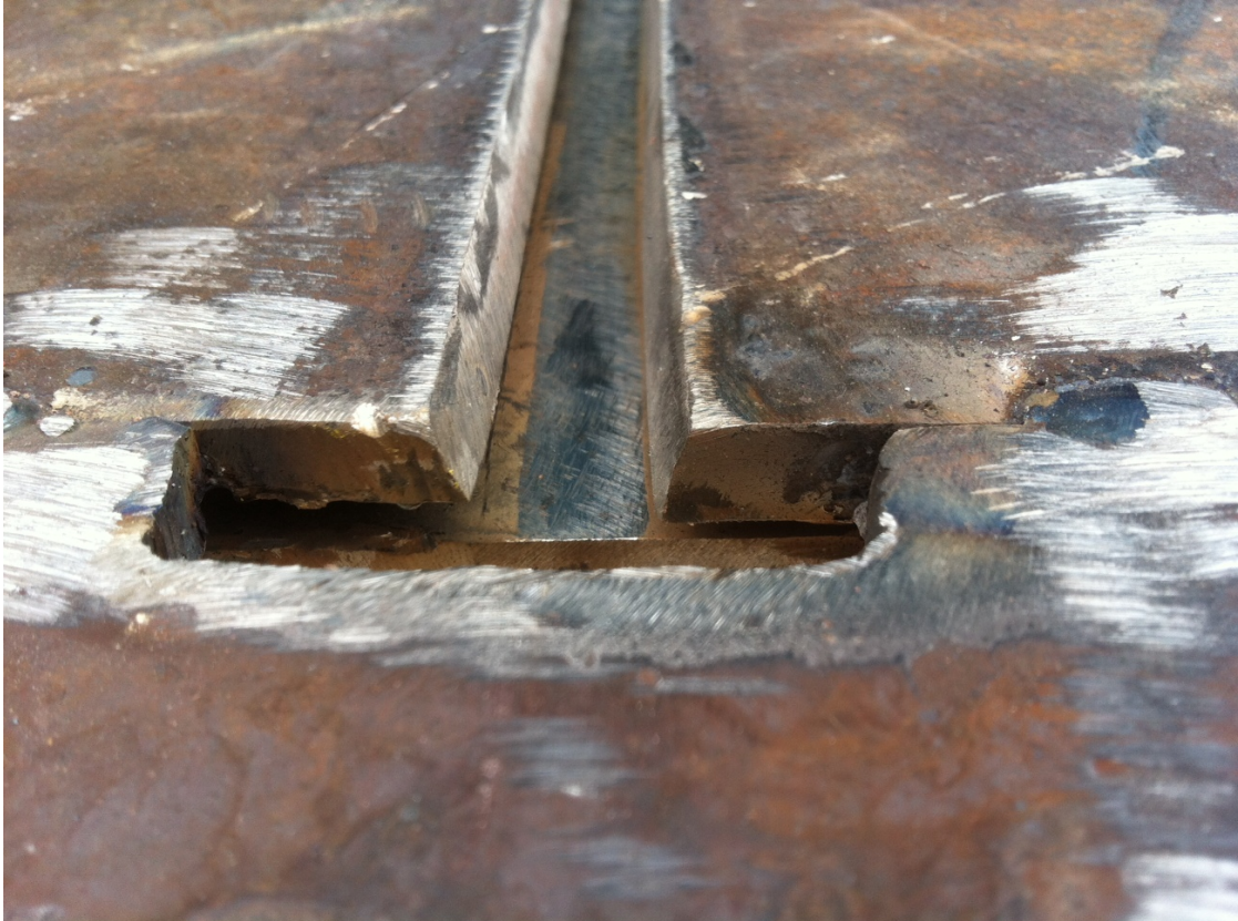
Photo n° 7 : Vue de dessus de la pièce préparé pour qualifier les soudeurs (jeu de 13 mm)